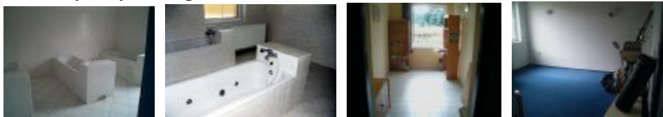
masážní místnost místnost na cvičení