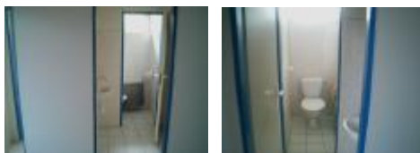
WC – nutné úpravy